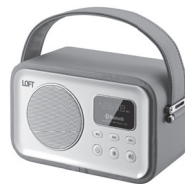
01 Speaker Bluetooth